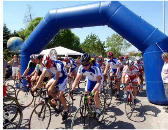
51 učesnik iz Slovenije, Hrvatske, BiH, Mađarske i Srbije