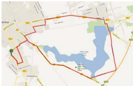
Skica staze ciklo-ture